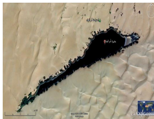
الشكل 1: الخارطة الجغرافية لبحيرة قبرعون بالجنوب الليبي (نينا، 2021)